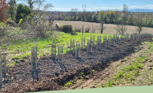
Figure 2 : Exemple d'une plantation de haie double rang à L'Abergement-Clémenciat en mars 2026

La plantation des haies peut se faire à partir de la période de repos végétatif, c'est-à-dire entre novembre et début mars.