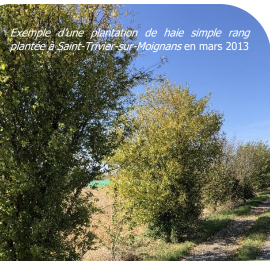
Exemple d'une plantation de haie simple rang plantée à Saint-Taviar-sur-Moignans en mars 2013